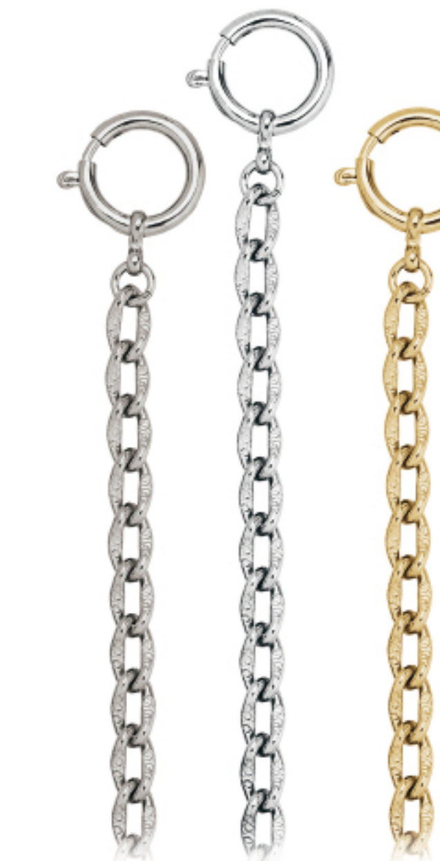
Art.Nr.: KC 109 C | KC 109 H | KC 109 V

Uhrkette Flashpalladium, hell, vergoldet, 28 cm