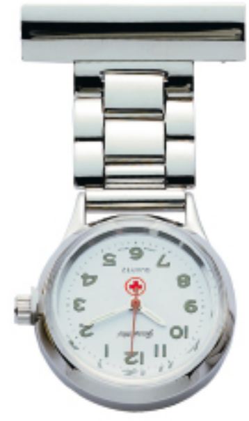
Art.Nr.: NW 605