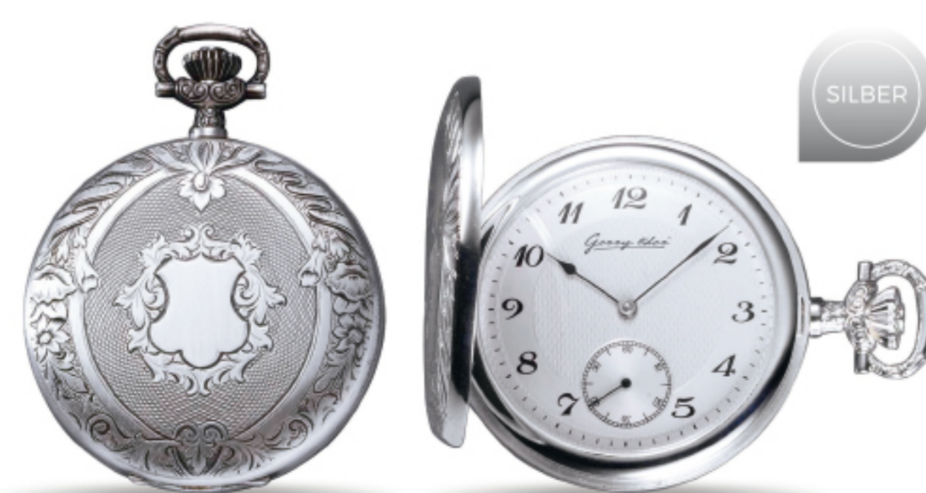
Art.Nr.: PW 101 AU

TU Silber (925/000) antik PTS 9310 50 mm