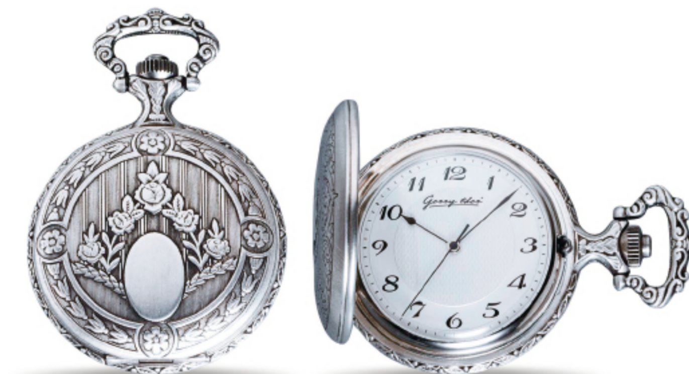
Art.Nr.: PW 202