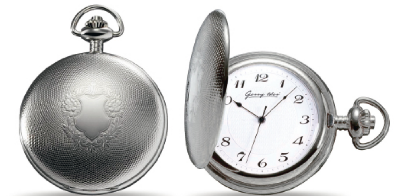
Art.Nr.: PW 301 TU verchromt 12 LC Handaufzug 51 mm