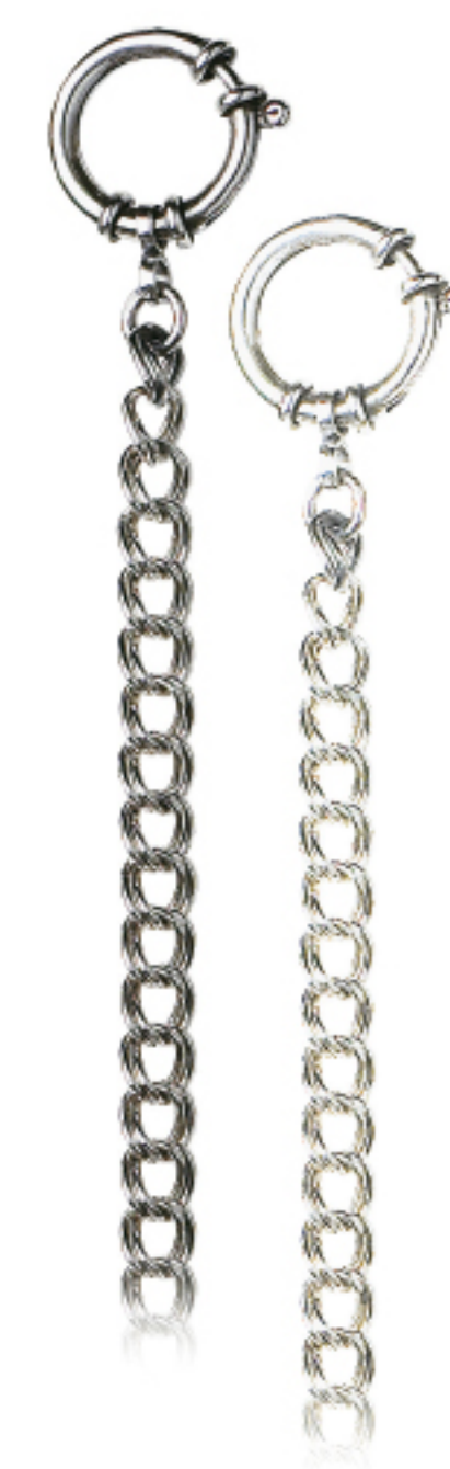
Art.Nr.: 38 / 1205 | 38 / 1205W Uhrkette Silber (925/000) 28 cm