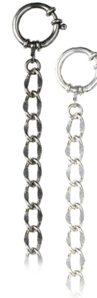
Art.Nr.: 38 / 1206 | 38 / 1206W Uhrkette Silber (925/000) 28 cm