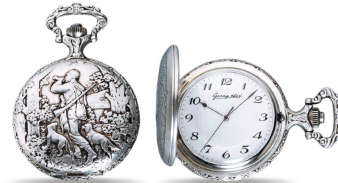
Art.Nr.: PW 207