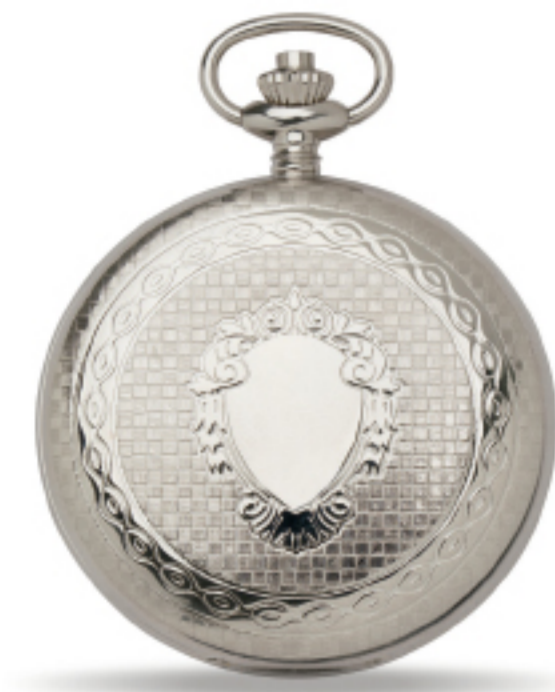
Art.Nr.: PW 407