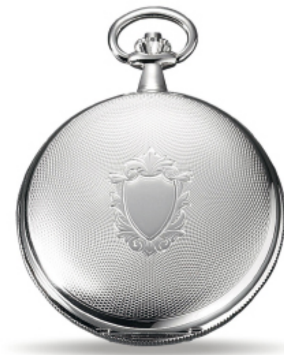
Art.Nr.: PW 402