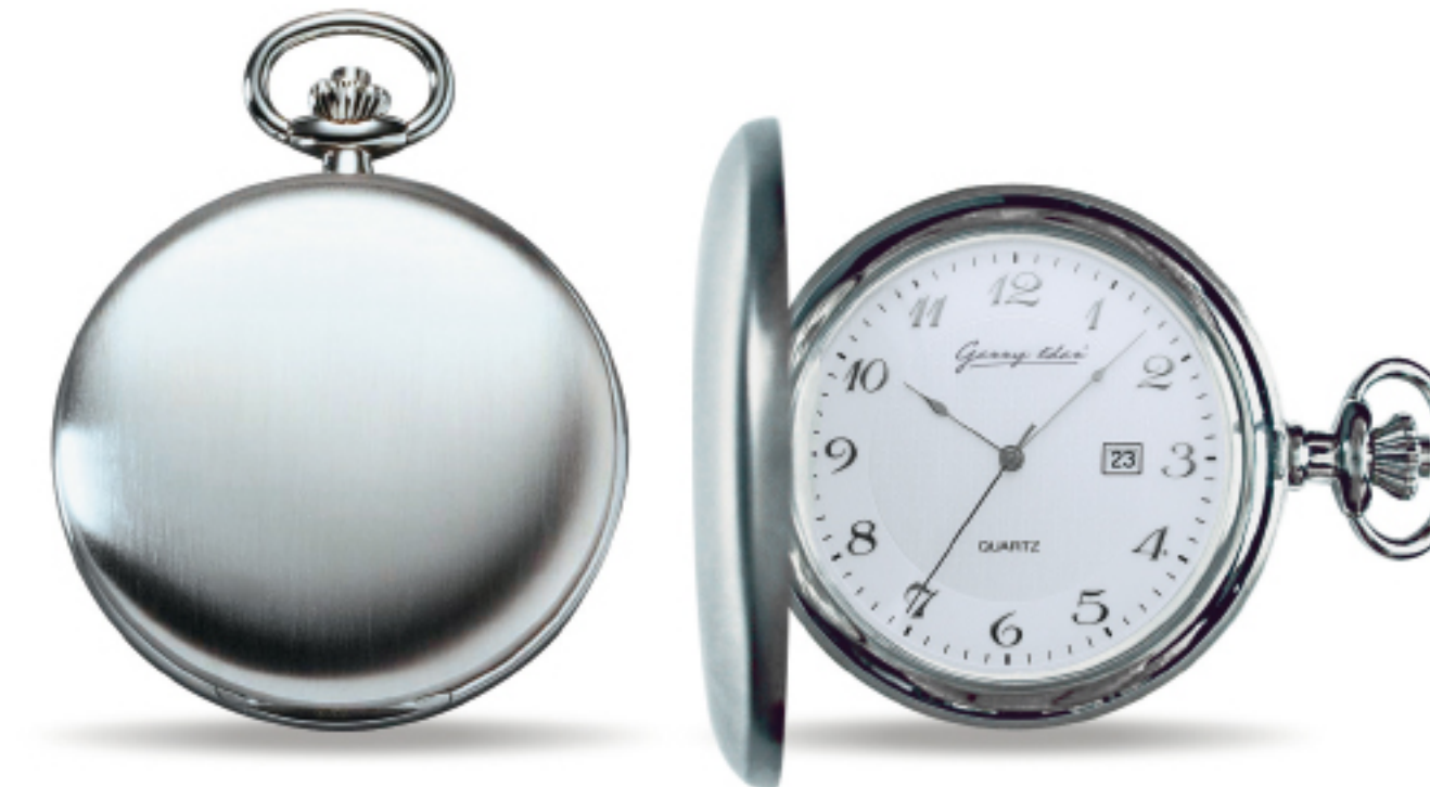
Art.Nr.: PW 406 Q TU Edelstahl Quarz 51 mm