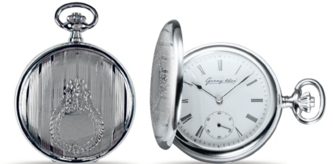
Art.Nr.: PW 401 U TU verchromt PTS 9310 50 mm