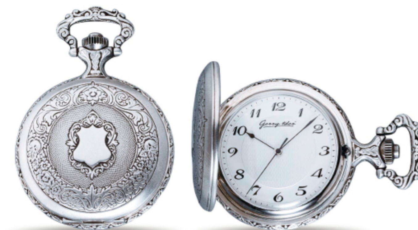
Art.Nr.: PW 201

TU Silber (925/000) antik PTS 9310 50 mm