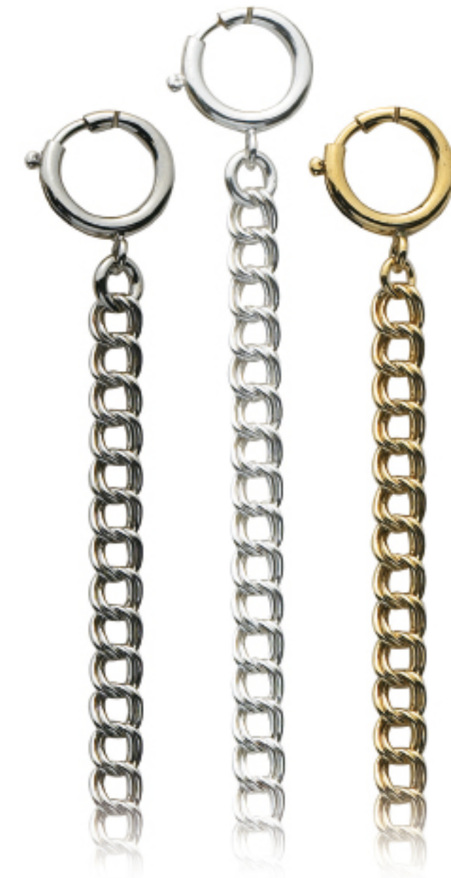
Art.Nr.: KC 100 C | KC 100 H | KC 100 V

Uhrkette Flashpalladium, hell, vergoldet, 28 cm