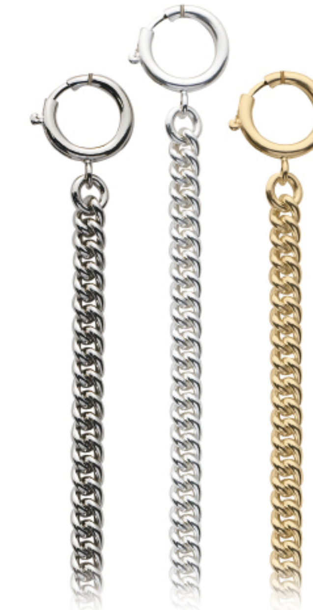
Art.Nr.: KC 102 C | KC 102 H | KC 102 V

Uhrkette Flashpalladium, hell, vergoldet, 28 cm