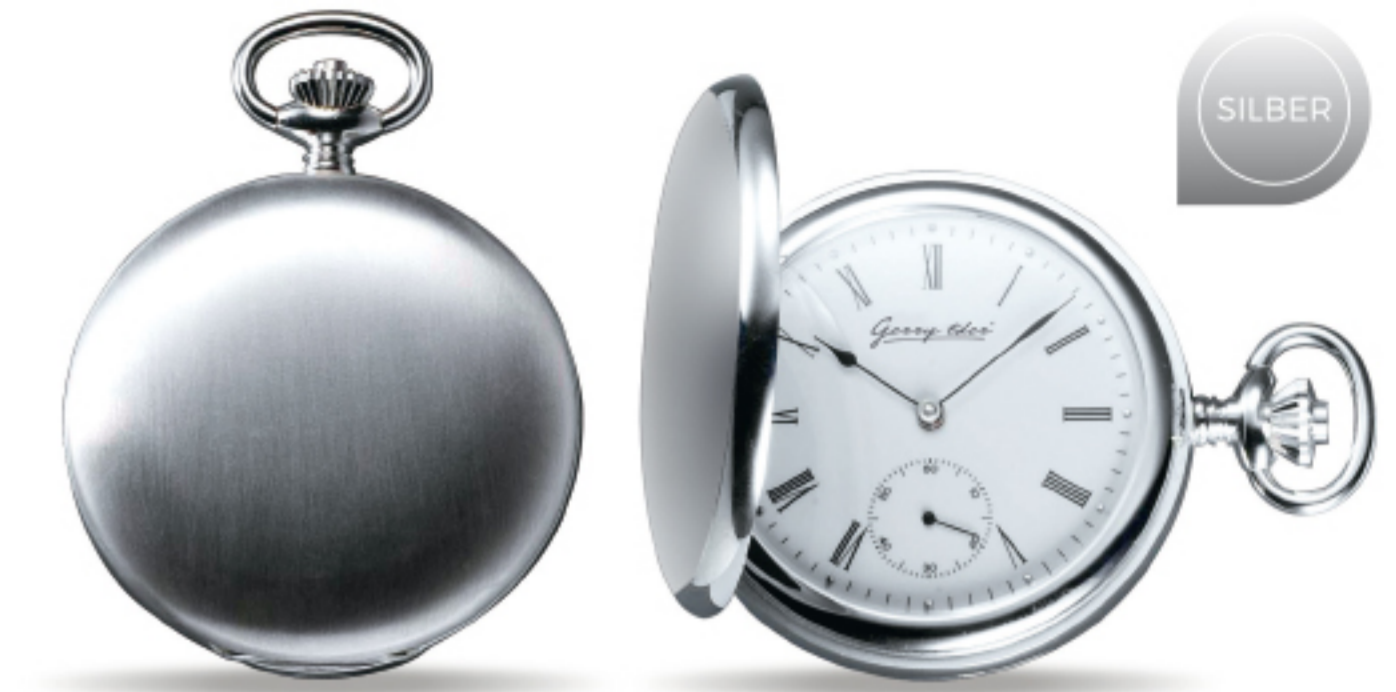
Art.Nr.: PW 102 U

Solide Uhren mit Silbergehäuse waren nun auch beim Bürgertum und bei wohlhabenden Bauern weit verbreitet, goldene Uhren mit besonders aufwendigen Werken ein Luxusgegenstand für Reiche. In der Zeit um 1900 erreichte die Taschenuhrenproduktion ihren Höhepunkt. Aus dieser Zeit stammen auch die meisten heute noch erhaltenen Exemplare.