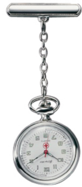
Art.Nr.: NW 601