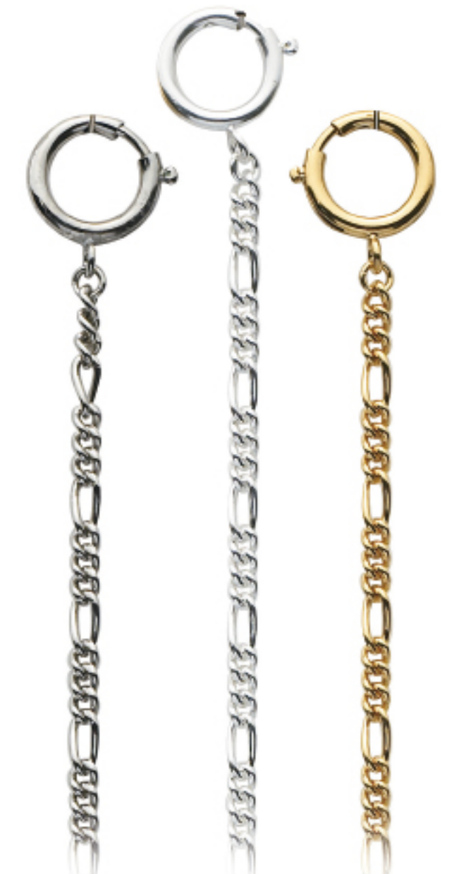
Art.Nr.: KC 103 C | KC 103 H | KC 103 V

Uhrkette Flashpalladium, hell, vergoldet, 28 cm