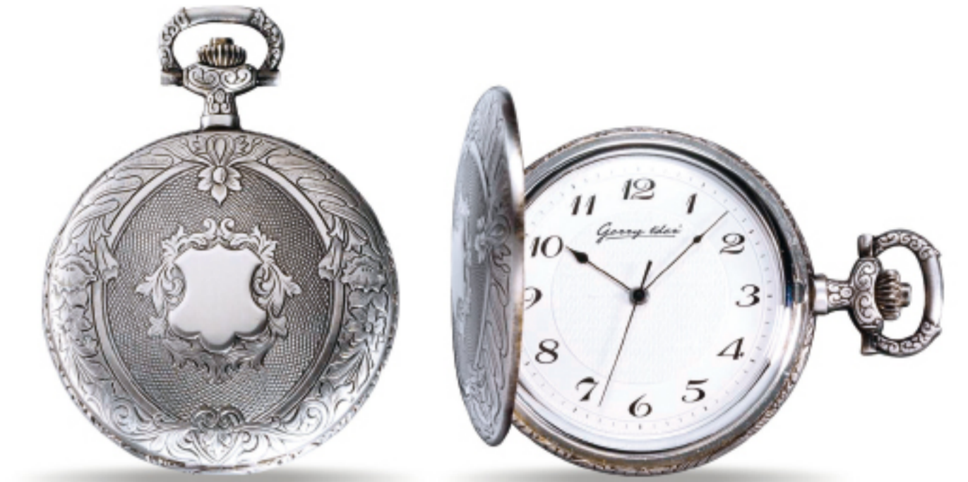
Art.Nr.: PW 209