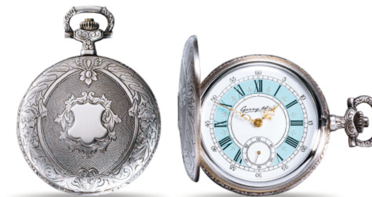
Art.Nr.: PW 209 B