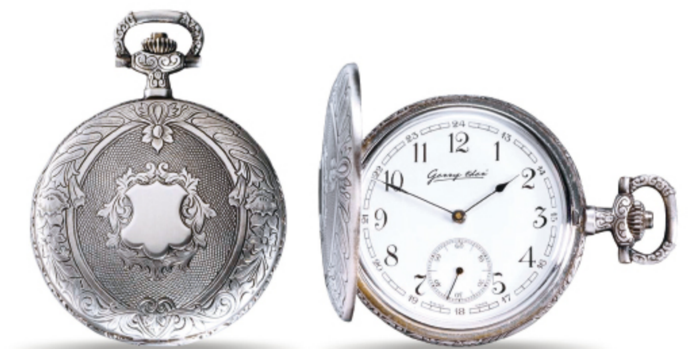
Art.Nr.: PW 209 U