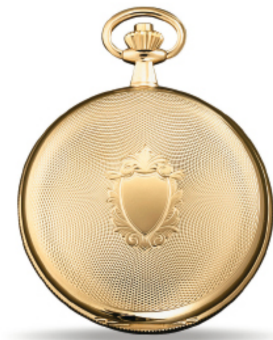
Art.Nr.: PW 402 V