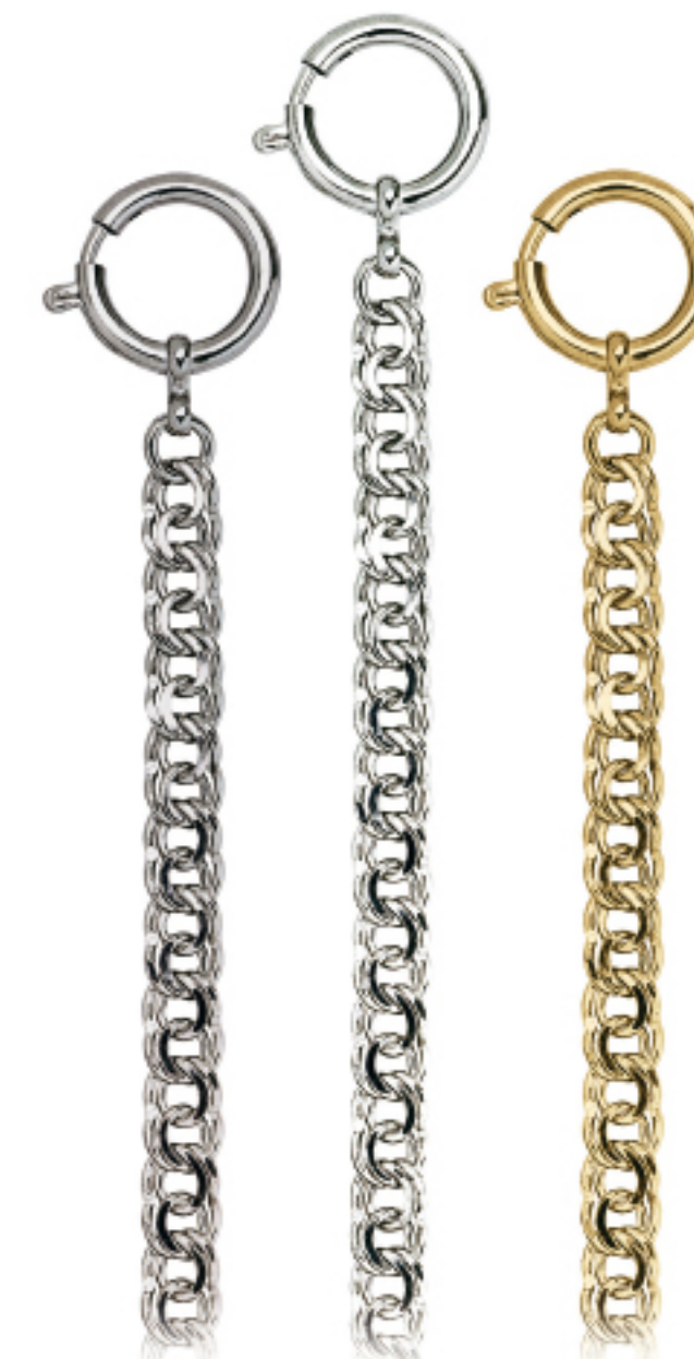
Art.Nr.: KC 108 C | KC 108 H | KC 108 V

Uhrkette Flashpalladium, hell, vergoldet, 28 cm