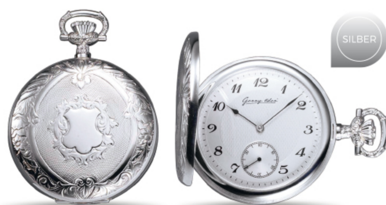
Art.Nr.: PW 101 U