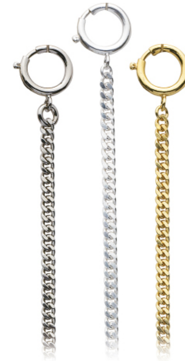
Art.Nr.: KC 101 C | KC 101 H | KC 101 V

Uhrkette Flashpalladium, hell, vergoldet, 28 cm