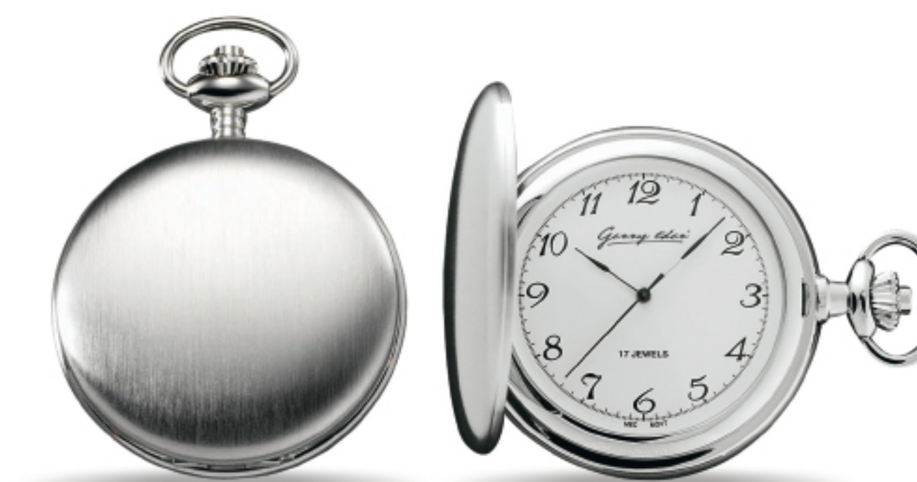
Art.Nr.: PW 302 TU verchromt 12 LC Handaufzug 47 mm