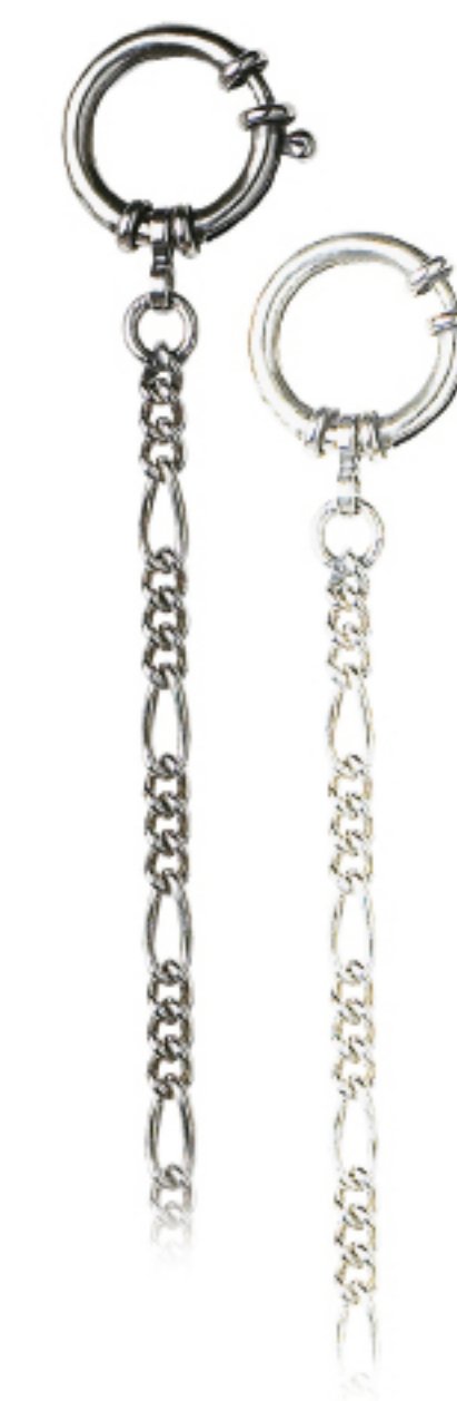
Art.Nr.: 38 / 1220 | 38 / 1220W Uhrkette Silber (925/000) 28 cm