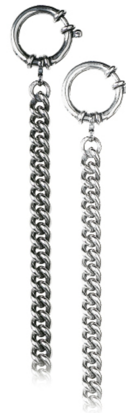
Art.Nr.: 38 / 1202 | 38 / 1202W Uhrkette Silber (925/000) 28 cm