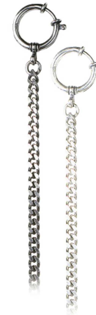
Art.Nr.: 38 / 1207 | 38 / 1207W Uhrkette Silber (925/000) 28 cm