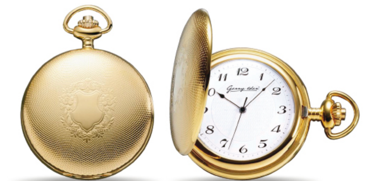
Art.Nr.: PW 301 V TU vergoldet 12 LC Handaufzug 51 mm