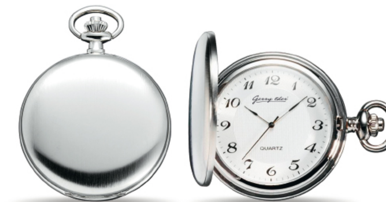
Art.Nr.: PW 303 Q TU verchromt Quarz 51 mm