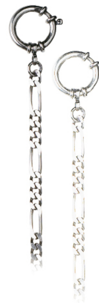
Art.Nr.: 38 / 1211 | 38 / 1211W Uhrkette Silber (925/000) 28 cm