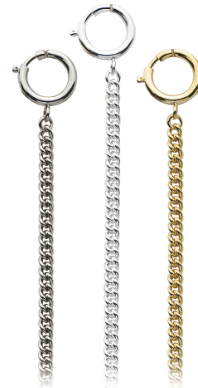
Art.Nr.: KC 107 C | KC 107 H | KC 107 V

Uhrkette Flashpalladium, hell, vergoldet, 28 cm