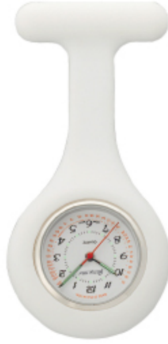
Art.Nr.: NW 607 | Art.Nr.: NW 608