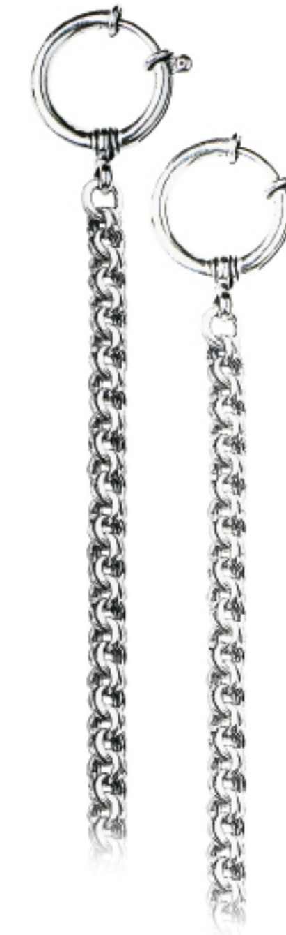
Art.Nr.: 38 / 1236 | 38 / 1236W Uhrkette Silber (925/000) 28 cm